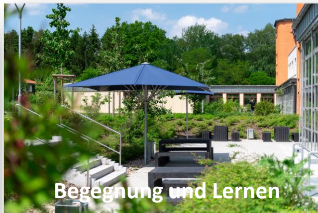
Begegnung und Lernen