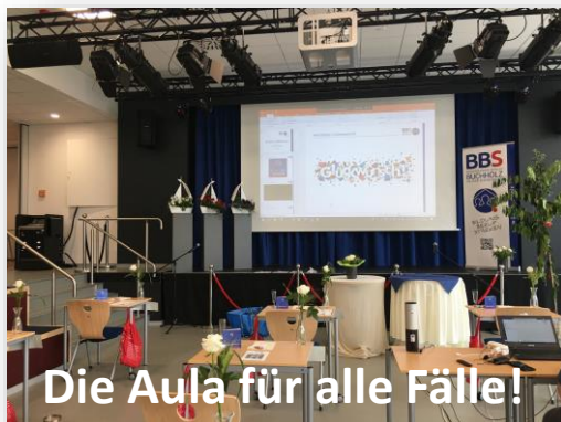
Die Aula für alle Fälle!