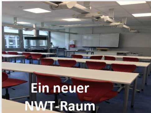
Ein neuer NWT-Raum